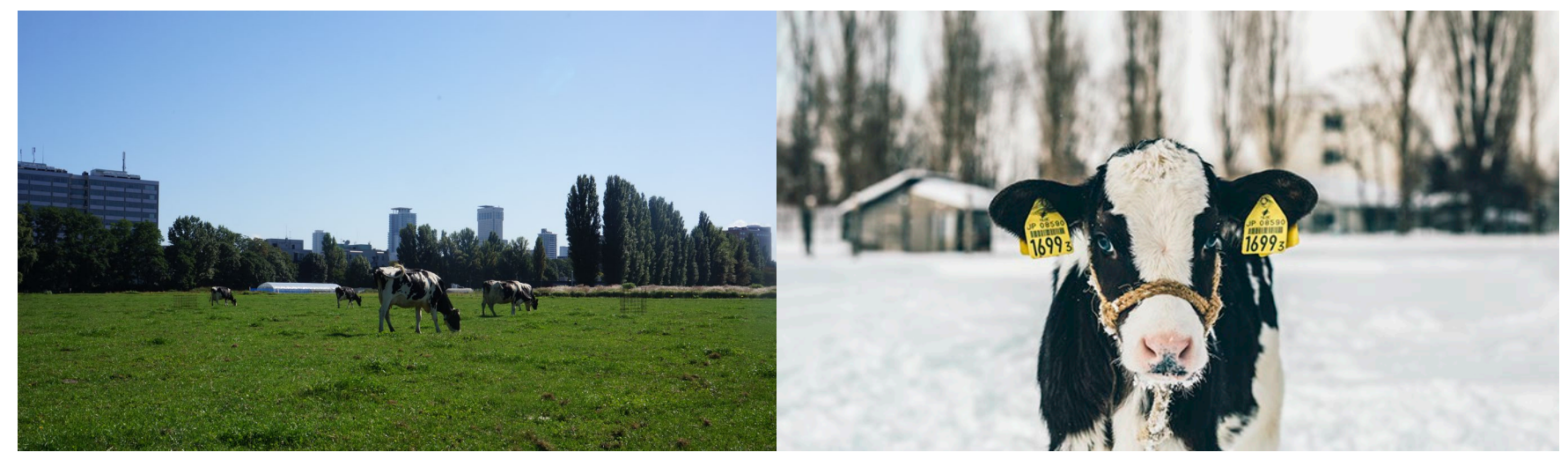
夏は放牧、冬は大学構内で作られたトウモロコシや干し草で育てられる