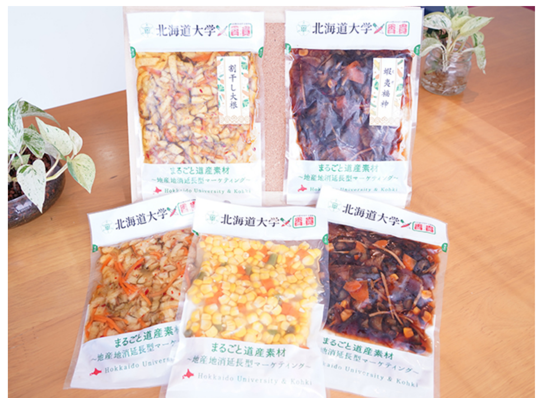
種類は「割干し大根」「割干し大根はくさい添え」「かぼちゃ大根」「しそ大根」「とうきびミックス」「蝦夷福神漬」「蝦夷しば漬」がある