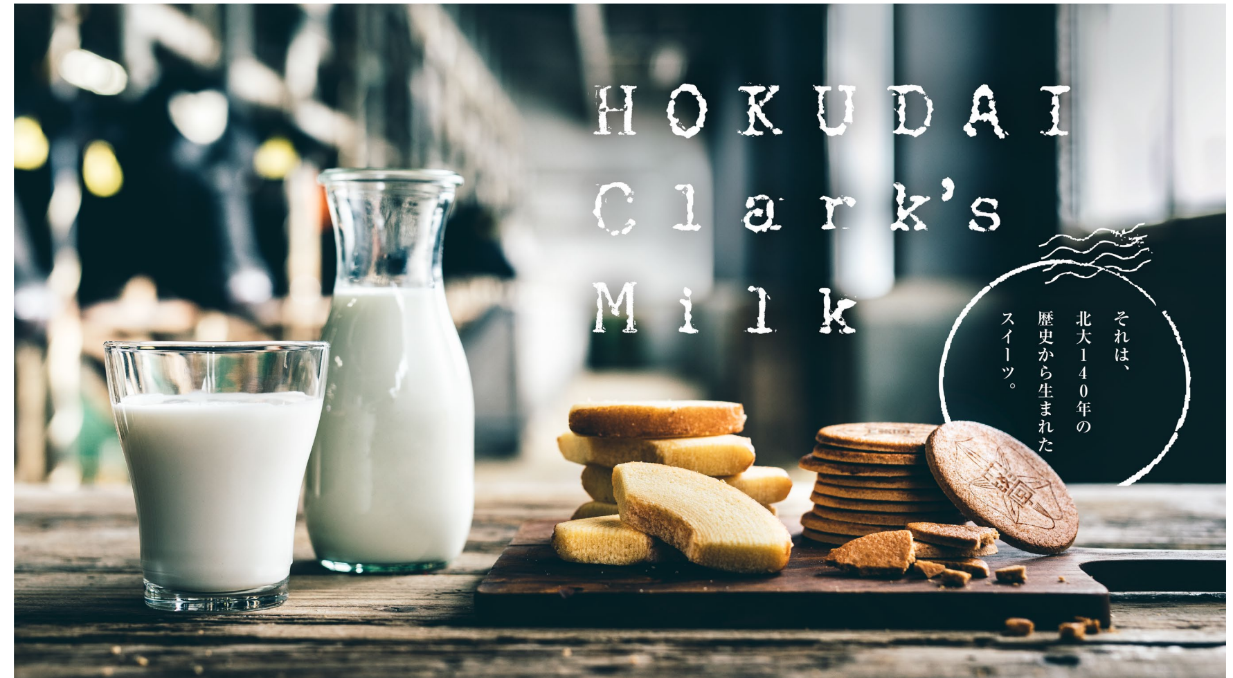
アイスクリーム、チーズ、焼き菓子などのラインナップが揃う